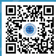
青岛船院 招生网站