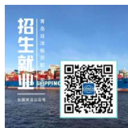
招生就业微信公众号