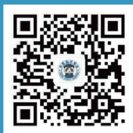
中国远洋海运 集团网站